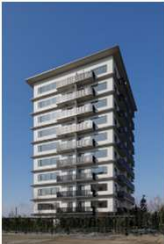
都市の木造化に向けた取組

都市部における 木質建築資材（JAS構造材、木質耐火部材、内装材等）の利用実証 を、 山元還元を促進する優先枠（SCM推進フォーラム等） を設けて支援します。 大径原木や 羽柄材・内装材等の利用拡大等 に向けた取組を支援します。 また、川上から川下までの事業者が連携した顔の見える木材を使用した構造材、家具・建具等の普及啓発等の取組を支援します。