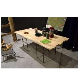
顔の見える木材を使用した構造材・家具等の普及啓発