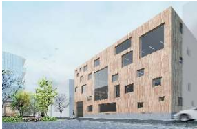
CLTを活用した街作りの実証

CLTを用いた先駆的な建築物の設計・建築や 街づくり等の実証 、建築物へのCLT・LVL等の利用促進や 設計の容易化 、設計者・施工者の育成等の普及・拡大を支援します。 木質建築資材の低コスト化・検証を支援 するとともに、 品質を保証するための仕組みの開発等 を実施します。