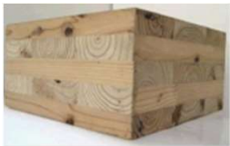
木質建築資材の開発

SCM推進フォーラムの設置・運営による 川上から川下までのマッチング や、 木材需給情報を収集・分析し発信する取組等 を支援します。あわせて、中高層建築物における木材の利用環境整備、製材品等の流通実態の調査を実施します。また、木材加工設備等導入の利子助成・リース、森林認証材の普及啓発等の取組を支援します。