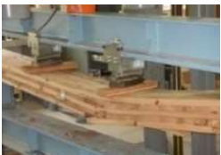
部材のデータ収集

※ このほか、令和2年度補正予算「合板・製材・集成材国際競争力強化・輸出促進対策」において木材製品の消費拡大対策等を実施。