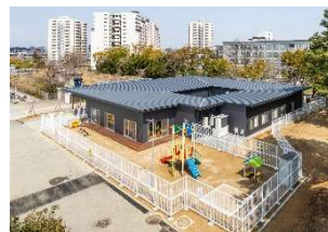
非住宅分野等の建築物へのJAS構造材の活用