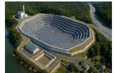
ごみ最終処分場のイメージ