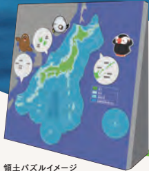
領土パズルイメージ

同時開催 夏休み親子イベント 「遊んで学ぶ領土のこと」 巨大領土パズルに挑戦しよう!