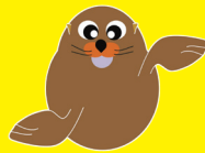
竹島のイメージキャラクター リャンこちゃん