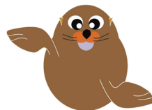
竹島のイメージキャラクター りゃんこちゃん