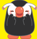
北方領土のイメージキャラクター エリカちゃん