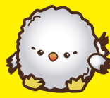
尖閣諸島のイメージキャラクター アルバちゃん

※展示やイベントの内容が予告なく変更・中止になる場合がございます。あらかじめご了承ください。