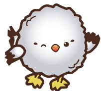
尖閣諸島のイメージキャラクター アルパちゃん