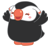
北方領土のイメージキャラクター エリカちゃん