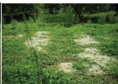
芝施工 4 週後