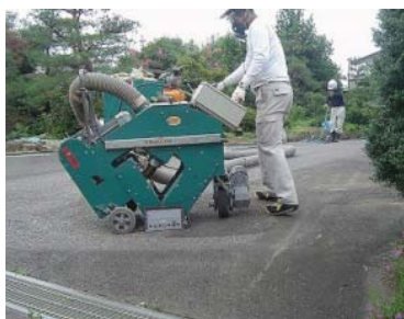
ショットブラスト

周囲に粉塵が飛び散らないよう措置（例：簡易ビニールテントの設置）して、振動ドリルでコンクリート表面を除去する。