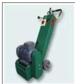
表面切削機（プレーナー）