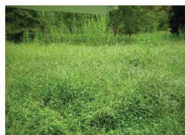
芝施工 7 週後