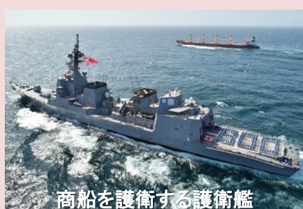
商船を護衛する護衛艦

海賊多発海域を航行する日本船舶において、国土交通大臣の認定を受けた特定警備計画に基づき、一定の要件を満たす民間武装警備員による乗船警備ができます。