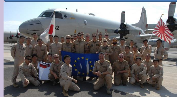
12月、日EU(ドイツ海軍)海賊対処共同訓練