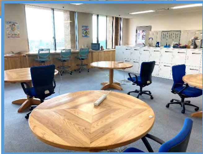
(職員が出勤する前の執務室の様子)