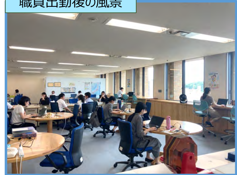
職員出勤後の風景