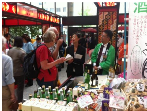
日本酒の試飲体験(宮城県)

○三菱地所株式会社と連携し、総会参加者をはじめとする外国人旅行者向けに日本各地の観光の魅力を紹介したPRイベント「Japan All In」において日本酒の試飲を実施した他、全国より厳選した蔵元の日本酒を取り揃えた日本酒BARを2012年10月8日～14日の期間限定でオープン。