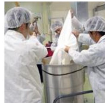
関谷醸造株式会社 酒造り体験コース