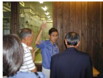
小澤酒造株式会社 酒蔵見学