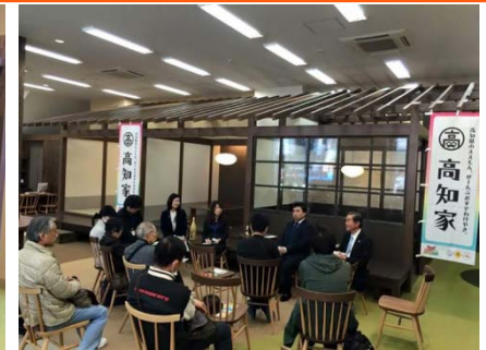
(移住フェアの様様)