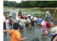
ため池の外来種駆除