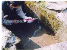
水路のひび割れ補修