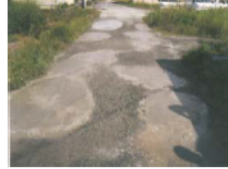
農道の窪みの補修