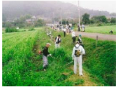
農地法面の草刈り