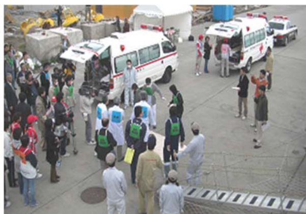
【徳島港における緊急透析患者を対象とした搬送訓練】