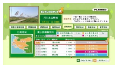
【河川水位情報画面】