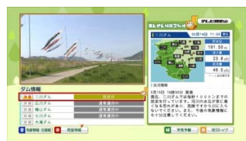
【テレビで「ダム情報」を提供】