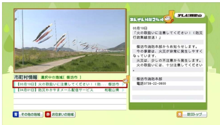
【市町村防災情報画面】