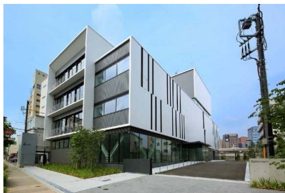
【株式会社NTTファシリティーズ新大橋ビル】