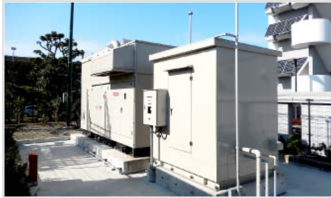
【足立トラックターミナルの非常用自家発電設備】