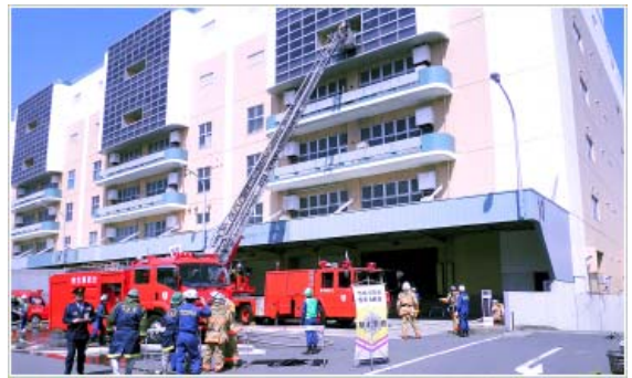
【配送センターでの消防訓練】