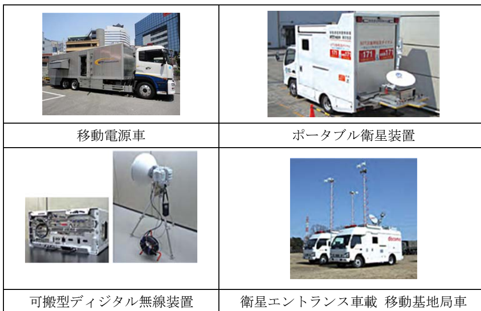
【NTT グループの災害対策機器・復旧用資材機器】

地震等の災害時出動し、搭載した衛星回線により、携帯電話が使用できないエリアをカバーする。