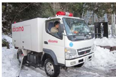
【電源確保のための移動電源車の出動】