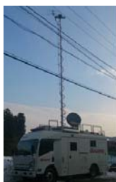
【移動基地局の設置】