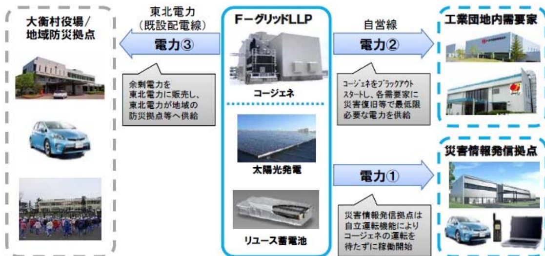
【非常時における地域との連携】