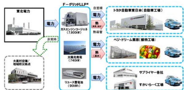
【「F-グリッド」事業の概要】