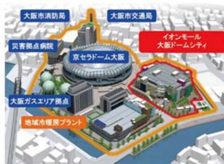
【イオン大阪モールドームシティの外観】