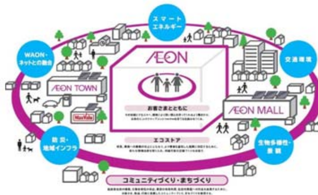
【防災対応型ショッピングモールのコンセプト】

④つたえる：インフォメーションコーナーを設置し、防災とエコの取組を情報発信する。