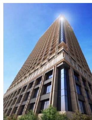
【東京日本橋タワー 外観】