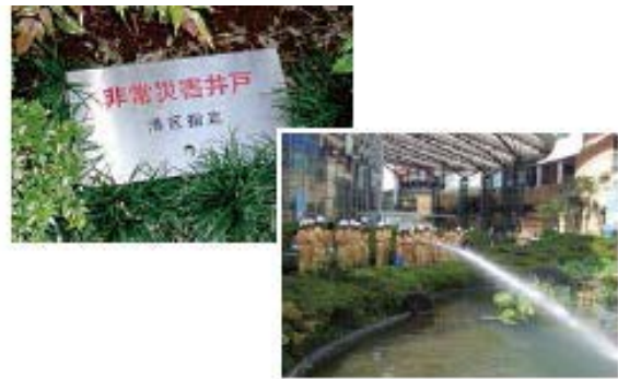
【非常災害用井戸と防災訓練時の様子】