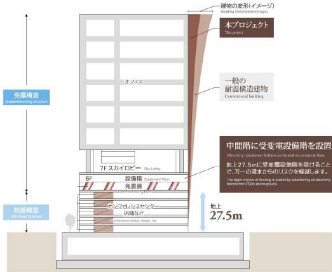
【災害時対応設備の配置模式図】