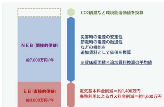
CGSによるスマート化の便益