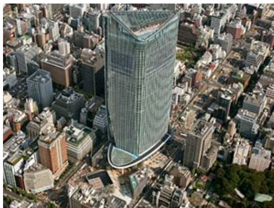
【虎ノ門ヒルズの外観】