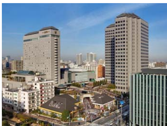
【東京イースト 21 の外観】