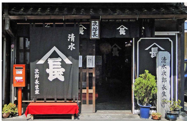
【清水次郎長の生家】