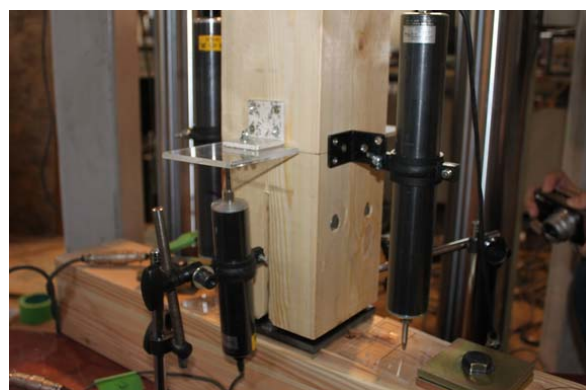
【木造住宅の耐震構造】