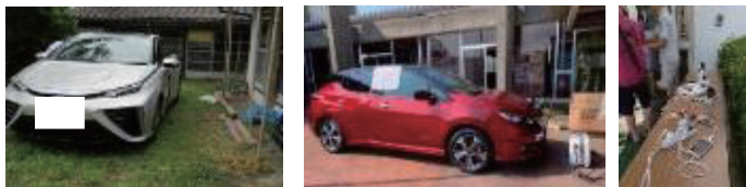
FCVからの給電：災害時に地域を巡回し、個人宅で照明、電子レンジ等に使用 EVからの給電：災害時に避難所等で携帯電話充電、扇風機、冷蔵庫等に使用