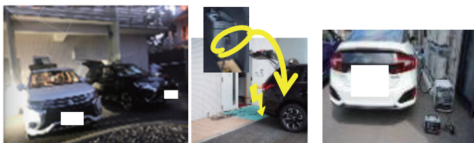
PHVからの給電：災害時に老人ホームで洗濯機・洗濯乾燥機に使用 FCVからの給電：災害時に老人ホームでエアコンや小型蓄電池の充電に使用