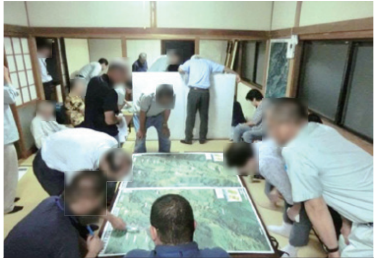
土砂災害警戒区域等の住民への周知状況