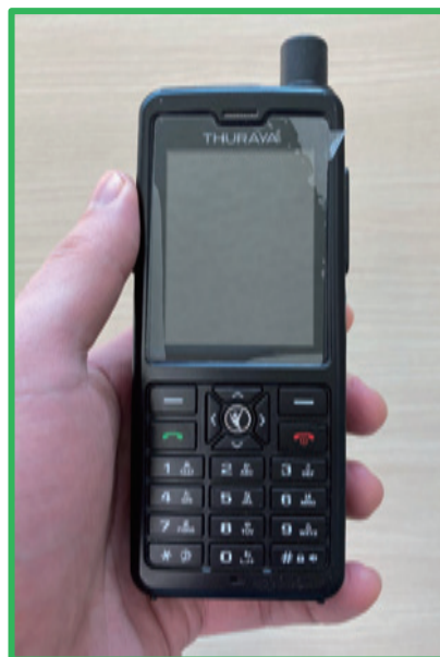
小型で携帯が可能なタイプ