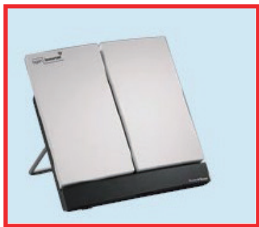
大型で設置が必要なタイプ