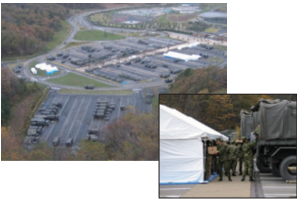
新潟県中越地震の際に拠点として活用された事例

今後、災害が発生した場合に、広域防災拠点としての司令塔機能等の中枢的機能を十分に発揮します。