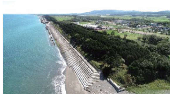
(効果イメージ) 海岸防災林による潮害等の防止

今後、海岸防災林が保全されることにより、森林による潮害防止等の機能が発揮され、台風等に伴う高潮等による被害発生を未然に防止します。