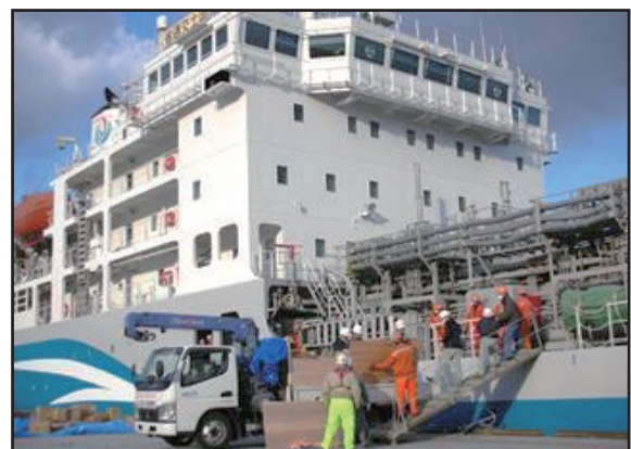
《緊急物資の陸揚げ状況（イメージ）》

事業完了後は、災害時において、支援船（貨物船、タンカー、官公庁船）の着岸が可能となり、水・食料、衣料などの緊急物資輸送を支えることが可能となります。