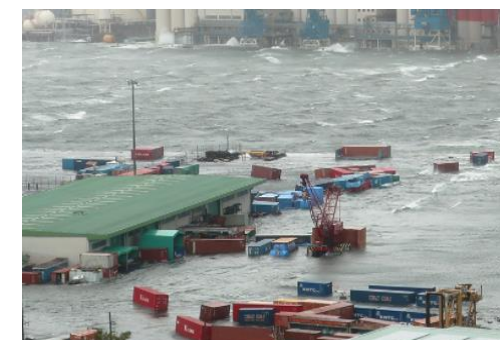
浸水による蔵置コンテナの流出