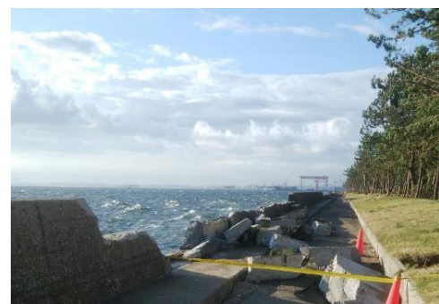
越波による護岸の倒壊