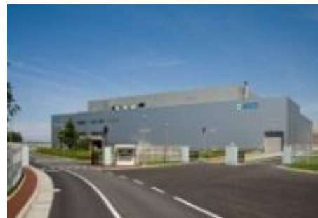
JESCO(高濃度PCB廃棄物処理施設)