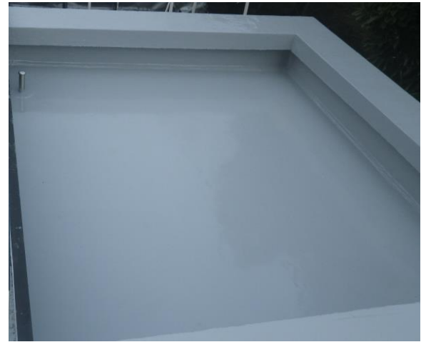
浴室棟屋上（施工後） 既存防水層を覆うようにウレタン塗膜防水を施工し、新たな防水層を形成した。