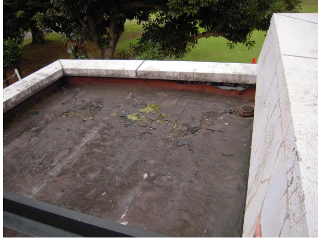
浴室棟屋上（施工前） 既存防水層の著しい劣化（亀裂・はがれ）が見られる。