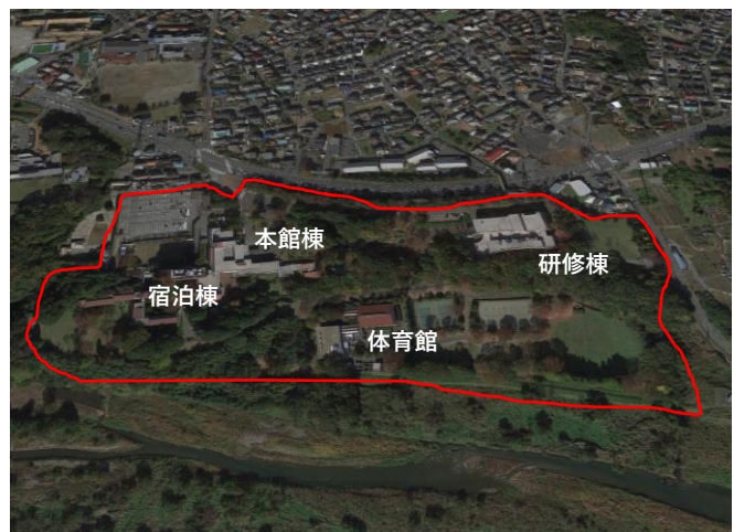
国立女性教育会館 全景

雨水の浸水やそれに伴う建物劣化を防止し、平常時の研修・宿泊利用及び災害時の避難所利用において、安心・安全に施設を提供できます。