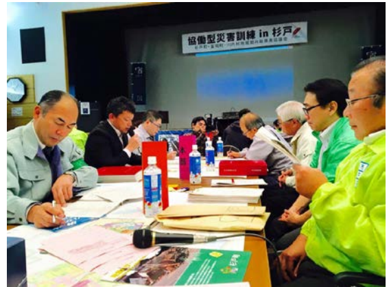
▲ICS リーダー研修の様子

明確にし、災害に対応するシステムである。その組織の5つの主要な機能は、指揮（Command）、実行（Operation）、計画（Planning）、後方支援（Logistics）、財務総務（Finance）から構成され、一元的な情報収集と指揮命令を行う現場指揮所を置くことで、近隣から参集した人材を組織化するのにも有効であり、グローバルスタンダードに使用されている。