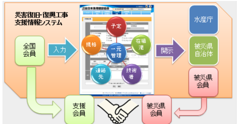
▲災害復旧・復興工事支援情報システムの概要