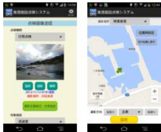
▲漁港施設点検システム