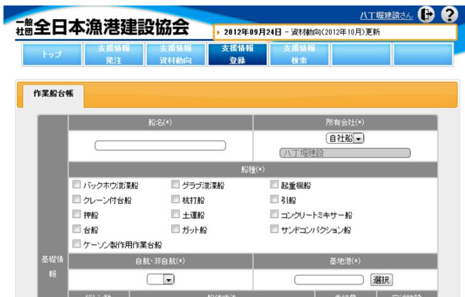
▲災害復旧・復興工事支援情報システム