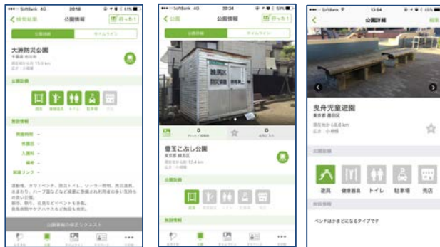
▲公園の防災設備情報を表示したスマホ画面