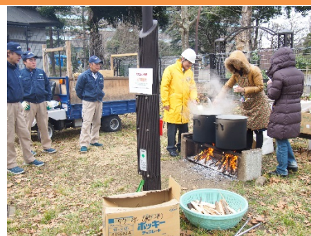
▲投稿されているカマドベンチ