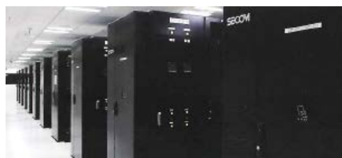
▲セコムあんしん情報センター