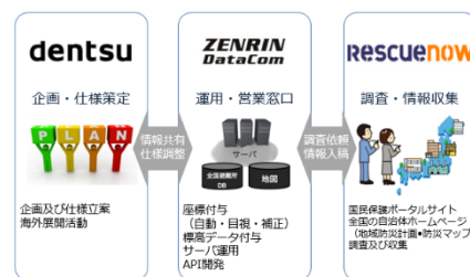
▲ 3 社による運用イメージ図