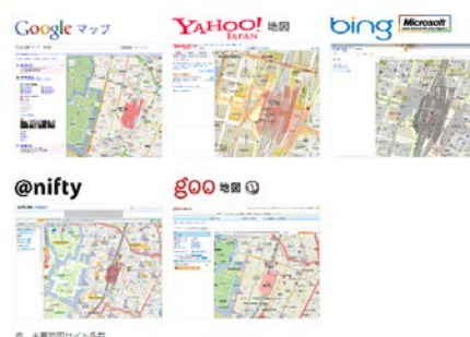
▲ 同社の地図採用実績の例