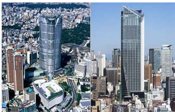
▲六本木ヒルズ（左）と虎ノ門ヒルズ（右）の外観