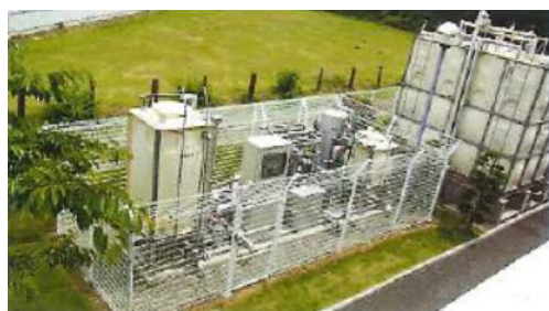
▲地下水膜ろ過システム