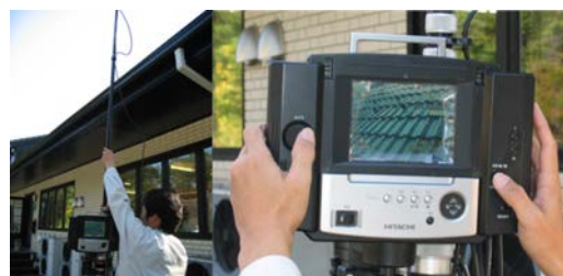
▲ポールカメラ診断の様子