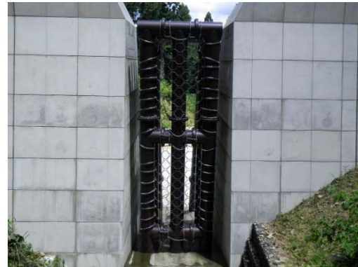
▲白狐保川えん堤（福井県）で使用しているグリッドネット