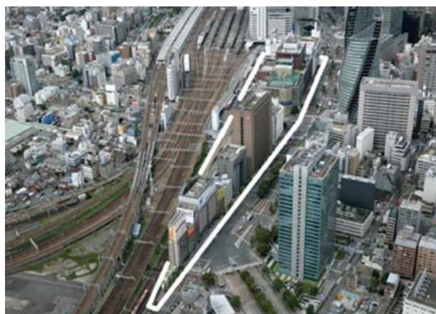
▲名駅南地区の位置（白線に囲まれたエリア）