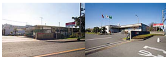
▲伊勢原工場（左）及び湘南工場（右）