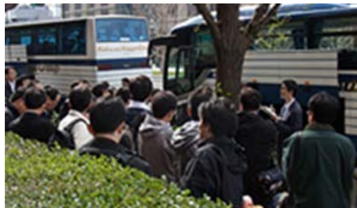
▲被災地やバックアップオフィスに向かう社員