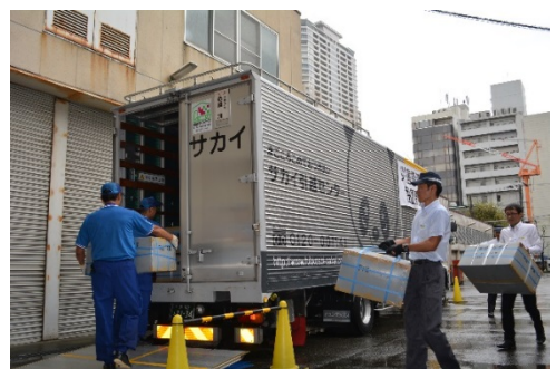
▲同訓練における機材搬出の様子