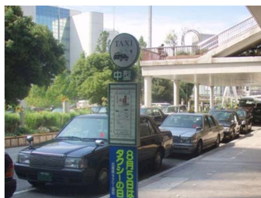
▲兵庫県タクシー協会に所属するタクシー