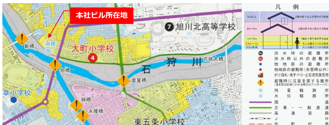
▲旭川市洪水ハザードマップ（右図は凡例）