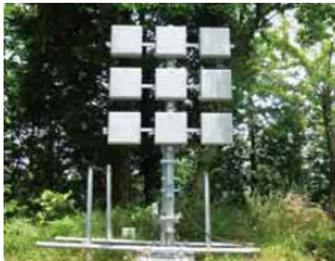
▲中継局間での電波の授受用のアンテナ