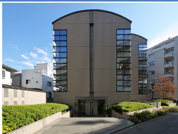
▲社員寮プレミアム初台