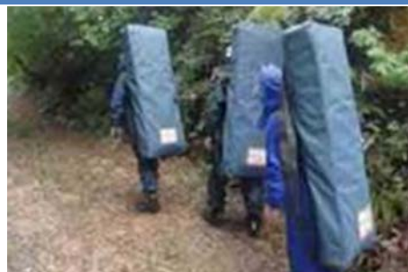
▲人力によるアンテナ運搬が可能