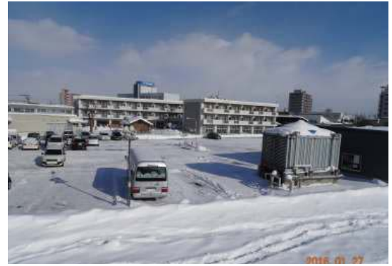
▲石狩川堤防より5本社ビルを望む