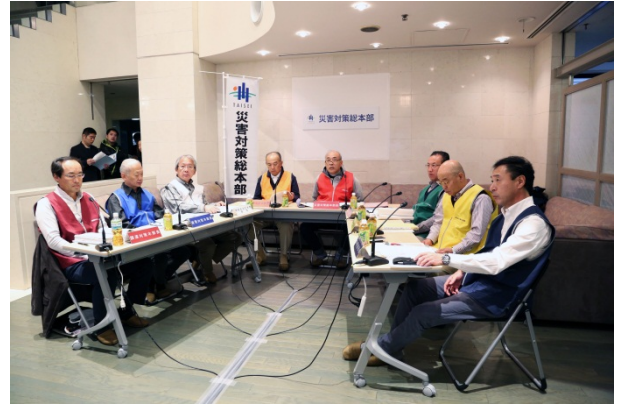
▲災害対策総本部の様子 (平成 27 年度大規模災害訓練)