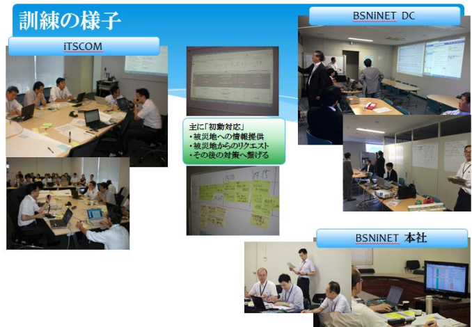
▲新潟市と世田谷区を結んだ被災地支援訓練の様子