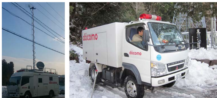
▲移動基地局の設置