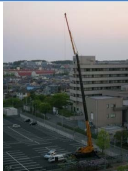
▲クレーン車での空中線設置