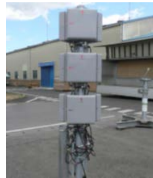
▲中継局から各家庭へ放送用のアンテナ