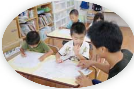
学ぶ力 読み書き・計算