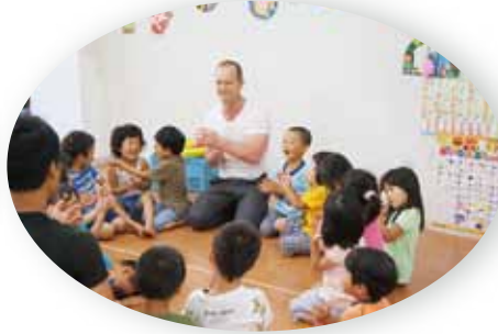
外国人講師による英会話