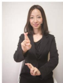
コールセンター 手話通訳者