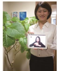
利用場所 駅、ホテル、会議など