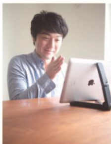
利用者 聴覚障がい者

遠隔手話通訳は、ビデオチャットを利用した手話通訳です。利用者（聴覚障がい者）の依頼に応じて、コールセンターに待機している手話通訳者が、パソコンやタブレット PC、スマートフォンなどを通して遠隔で手話通訳や電話代行などのサービスを行っています。必要と感じたときに短時間でも気軽に手話通訳を利用できることが大きな特徴です。