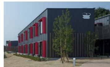
CLT工法による木造ホテル

《採択実績》 合計67件 (平成22~26年度までの前身事業の実績を含む) (近年の年度別) 24年度:7、25年度:7、26年度:5、27年度:8、28年度:22(うち実験棟5)