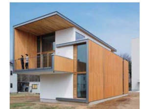
CLT工法による実験棟