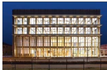
木質ハイブリッド構造部材を使用した耐火建築物