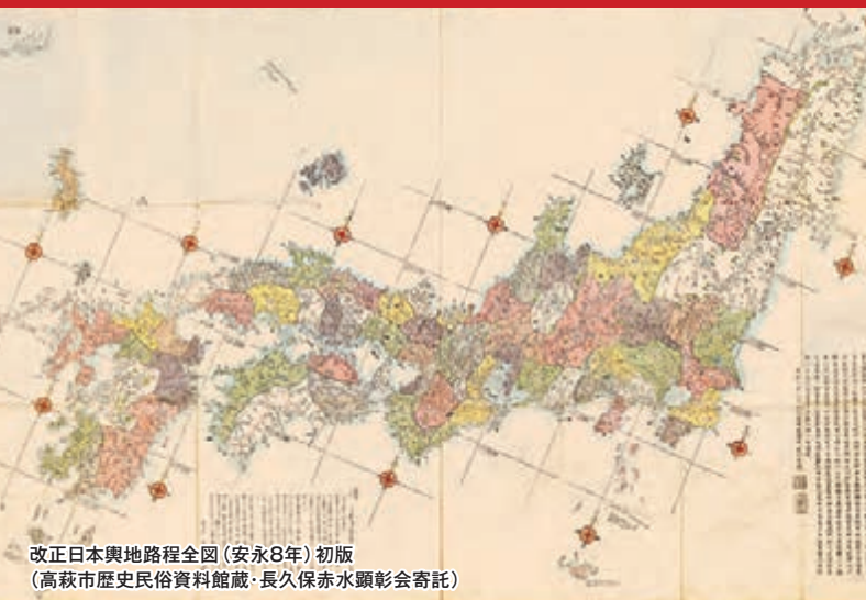
改正日本輿地路程全圖 (安永8年) 初版 (高萩市歴史民俗資料館蔵・長久保赤水顕彰会寄託)