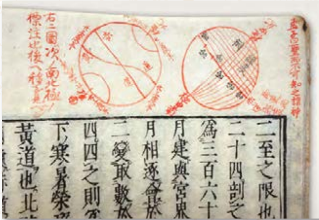
天経或問 天 (高萩市歴史民俗資料館蔵)

長久保赤水是、約300年前の1717(享保2)年、現在の茨城県高萩市に生を受けました。赤水是、長年考証を重ね、1779(安永8)年、63歳の時、「改正日本輿地路程全図」(赤水図)を完成させました。本展では、赤水図の作成過程や、赤水が作成したその他の地図や書物を紹介し、赤水の足跡を辿ります。