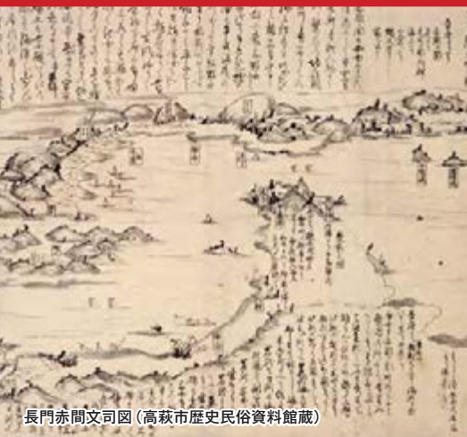
長門赤間文司図 (高萩市歴史民俗資料館蔵)