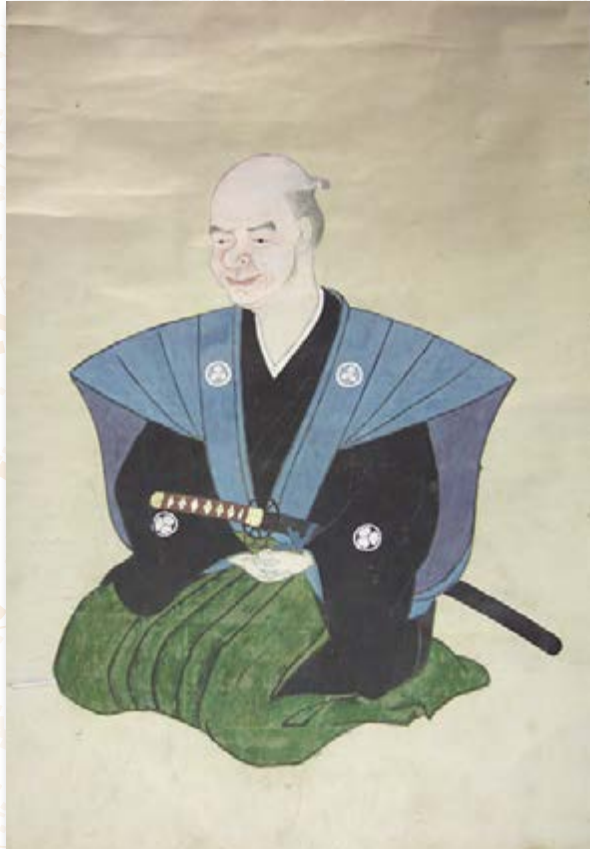
自画像 (高萩市歴史民俗資料館所蔵)