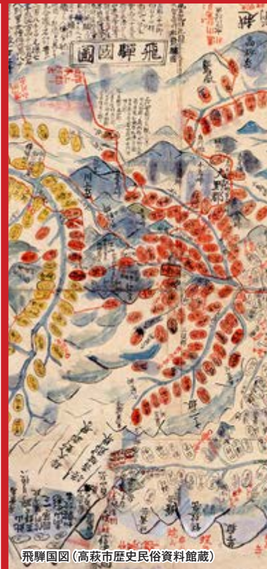
飛騨国図

[休館日] 土・日・祝 (7月21日・8月4日は開館 (11:00~17:00))