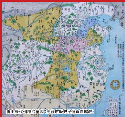
唐土歴代州郡沿革図 (高萩市歴史民俗資料館蔵)