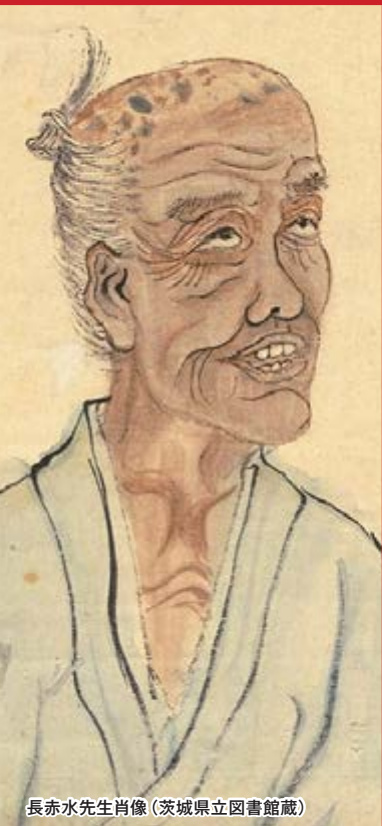
長赤水先生肖像