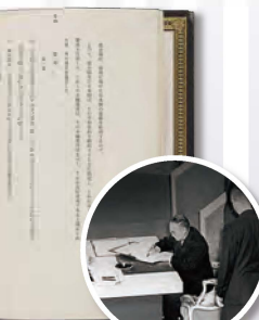
サンフランシスコ平和条約調印式