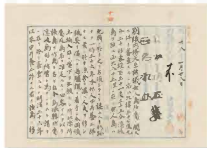
竹島編入に関する閣議決定文書 (1905年1月28日)