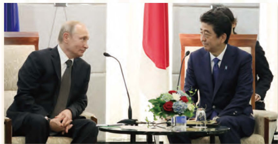
プーチン大統領と会談する安倍総理