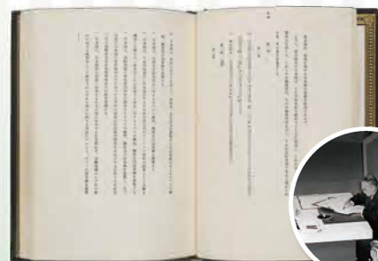
サンフランシスコ平和条約