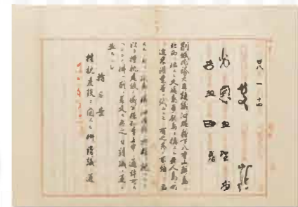
尖閣諸島編入に関する閣議決定文書 (1895年1月14日)