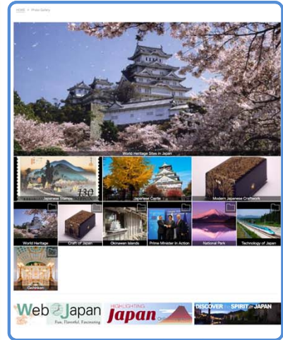
Photo Gallery 等

各省庁等の広報から、国際関係の情報を中心に電子新聞風に構成して提供し(毎週発信予定)、読者の拡大を図る。